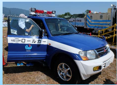
河川管理のための河川パトロールカー展示(試乗可)