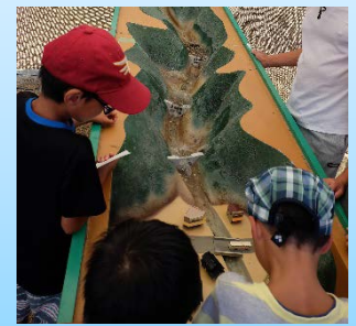
砂防堰堤の仕組みを学べる土石流模型実験