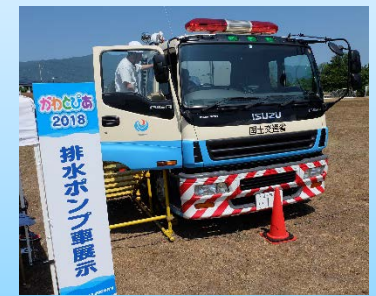
60m 3 /sの排水能力をもつ排水ポンプ車展示(試乗可)