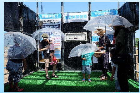
最大200mm/hの雨量が体験できる降雨体験装置