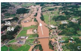
国道4号が浸水、JRに影響した二本松市内