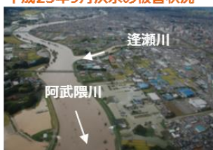
計画高水位を超過した郡山市