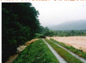
荒川の破壊の様子（日之倉橋上流右岸）