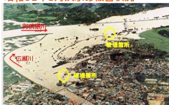
家屋の浸水被害が発生した伊達市梁川町内