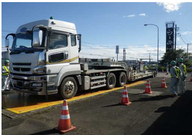
特殊車両の重量測定状況