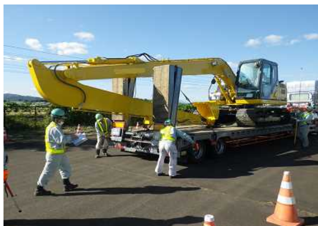
特殊車両の寸法測定状況