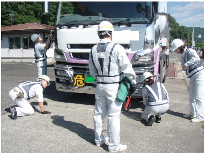
猪苗代車両検測所