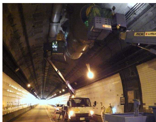
▲換気設備（ジェットファン）点検イメージ