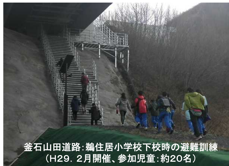
釜石山田道路:鵜住居小学校下校時の避難訓練 (H29.2月開催、参加児童:約20名)