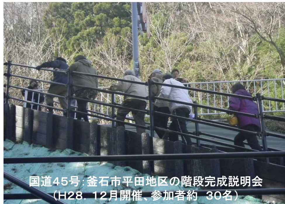
国道45号:釜石市平田地区の階段完成説明会 (H28.12月開催、参加者約30名)