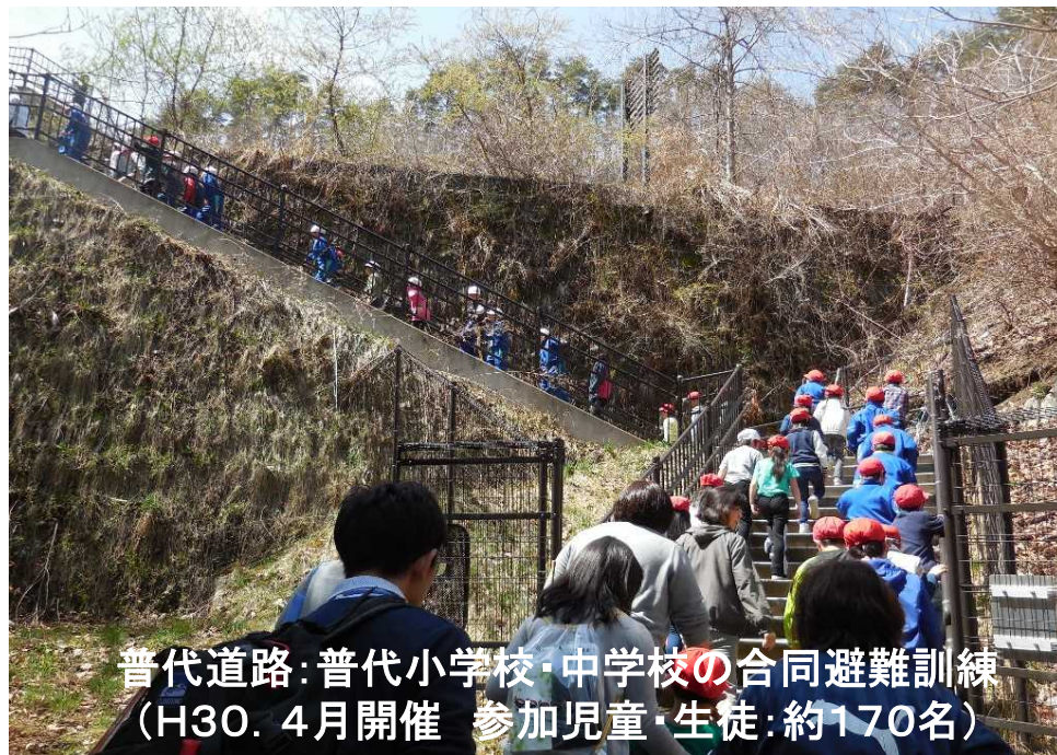
普代道路:普代小学校・中学校の合同避難訓練 (H30.4月開催 参加児童・生徒:約170名)