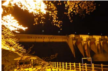
四十四田ダム 夜間ライトアップ