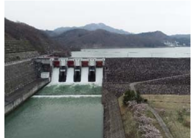
御所ダム クレストゲートからの点検放流

※湯田ダム(西和賀町)では4月20日21日に点検放流を行います。詳しくは下記をご覧ください。