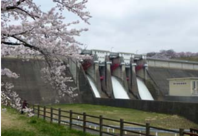
四十四田ダム クレストゲートからの点検放流