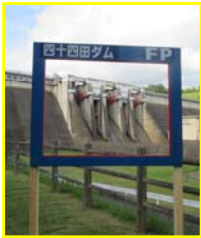
ダムカード風 フレームもあります