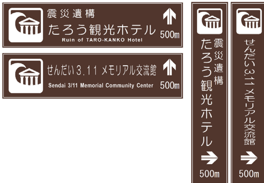
図3 表示板の記載例