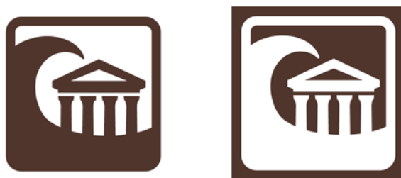
図1 標章（ピクトグラム）