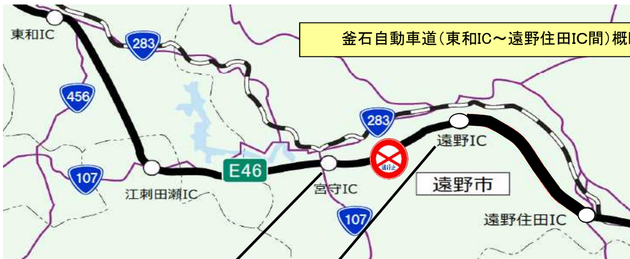
釜石自動車道(東和IC~遠野住田IC間)概略図