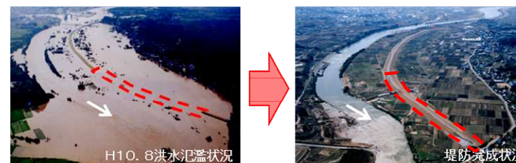
平成10年8月末洪水と平成の大改修(伊達市)