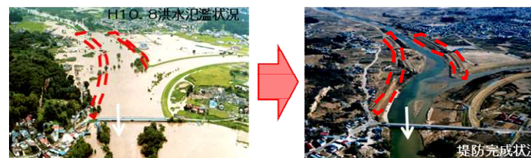
平成10年8月末洪水と平成の大改修(須賀川市)