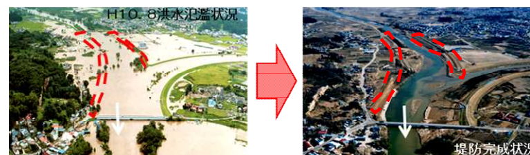
平成10年8月末洪水と平成の大改修(須賀川市)