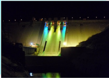
▲昨年の浅瀬石川ダム“冬のライトアップ”

はまた一味違う、巨大な白いキャンバスに照らされる冬ならではの表情を見せてくれます。