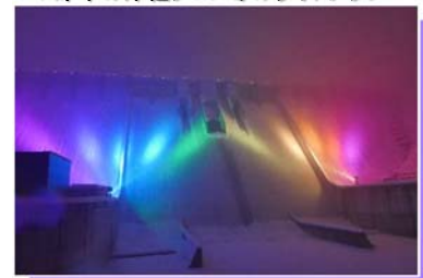
▼昨年の津軽ダム“冬のライトアップ”