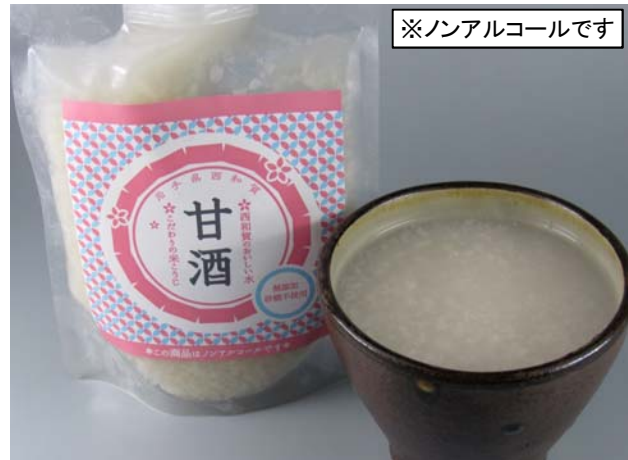
西和賀産温かい甘酒(サービス)