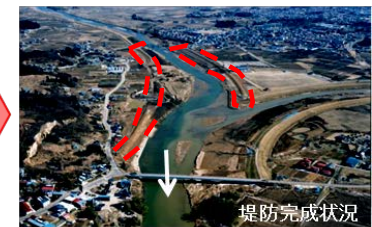
平成10年8月末洪水と平成の大改修(須賀川市)