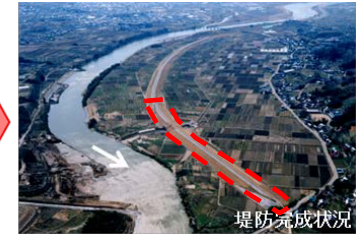
平成10年8月末洪水と平成の大改修(伊達市)