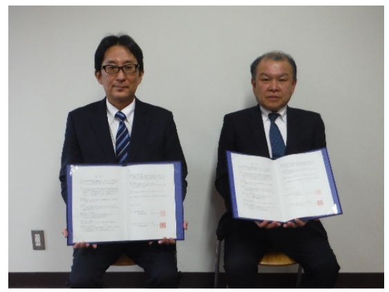
全国土木コンクリートブロック協会東北地区協議会と東北技術事務所長による覚書締結(平成30年3月16日)