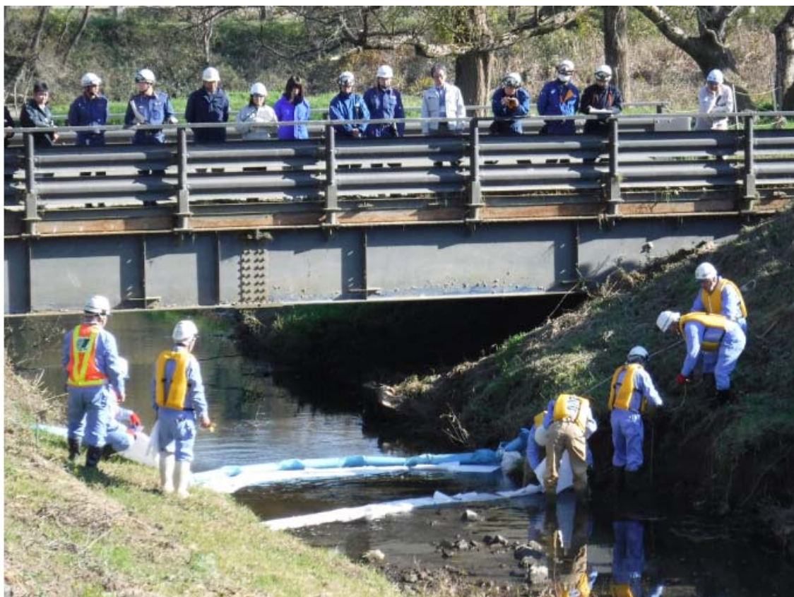
▲ 一関市(北上川水系磐井川支川 一関水辺プラザ内)