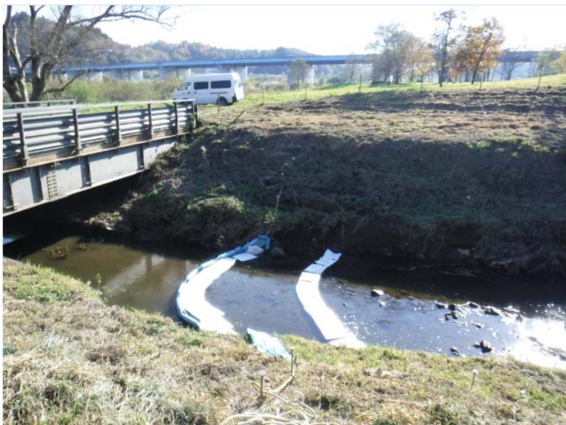
▲ 一関市(北上川水系磐井川支川 一関水辺プラザ内)