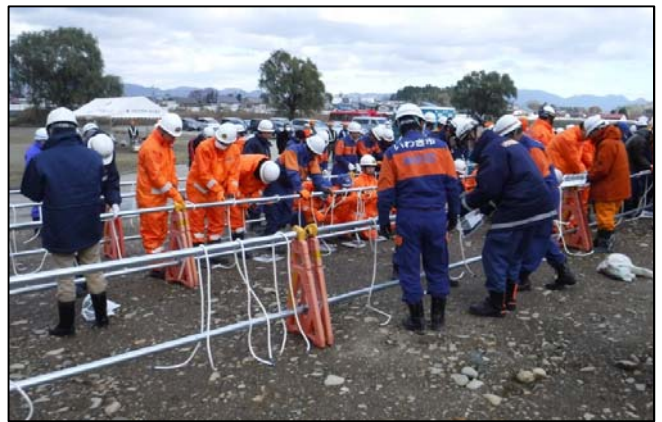
②ロープワーク（縄結び）実施状況