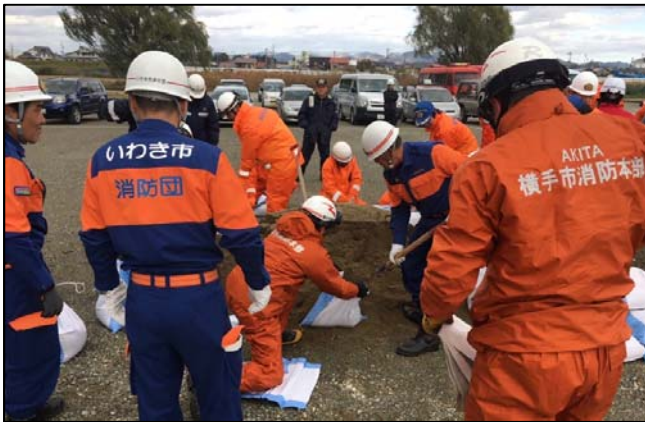
①「土のうの作り方」実施状況