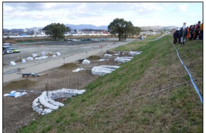
④「シート張り工」実施状況