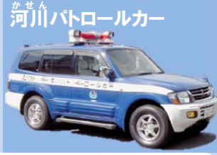
かせん 河川パトロールカー