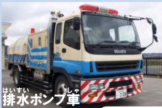
はいすい しや 排水ポンプ車