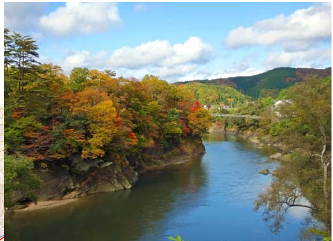
西和賀の紅葉の名所の一つ 「焼地台公園」

2. 現場見学会実施場所 10:00～ 焼地台公園駐車場(集合) 10:05頃～ 施工状況見学 11:00頃 見学終了