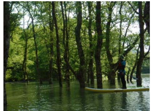
5月の焼地台エリア