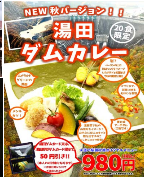
＜温泉&西和賀グルメ、スイーツもセットで楽しめます＞