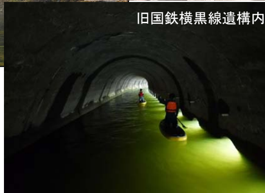
＜全国初の「旧国鉄横黒線遺構を巡る水上散歩(SUP)ツアー」＞