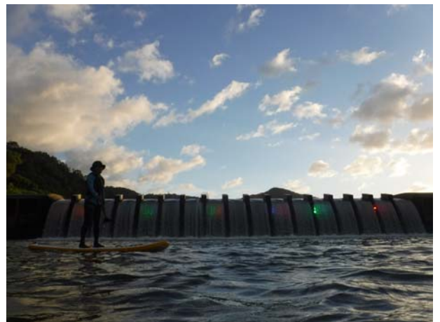
「サマーフェスティバルinにしわが」のSUP体験イメージ