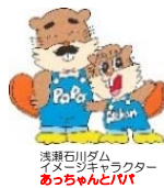
浅瀬石川ダム アニメーションキャラクター あっちんと/VT