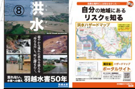
⑧ 平成30年に発生した災害、昭和42年羽越水害に関するパネル、タブレット端末を使用した調べるコーナー