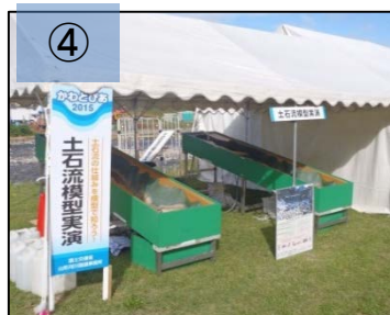
④ 砂防堰堤の果たす役割を模型を使って再現