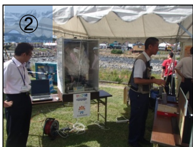
② 雷実験など気象に関する展示