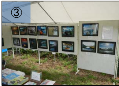
③ 写真コンテスト入賞作品の展示