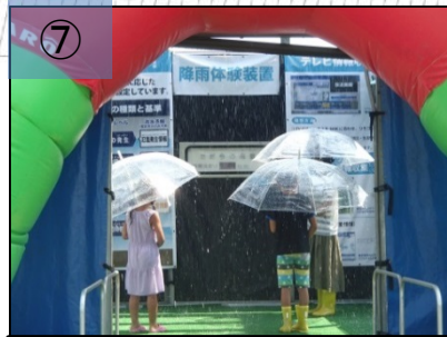
⑦ 時間雨量200mmの大雨を体験