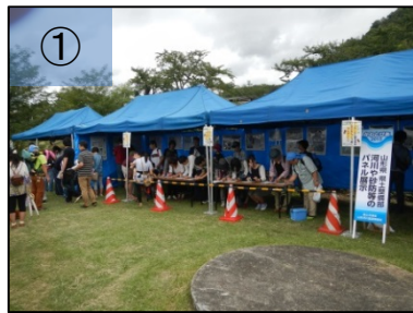
① 河川や砂防に関するパネル等の展示