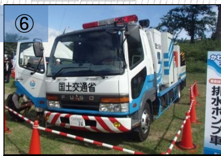
⑥ 排水ポンプ車等の乗車体験 (25mプールの水を10分で排出)