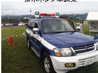
河川パトロールカー試乗