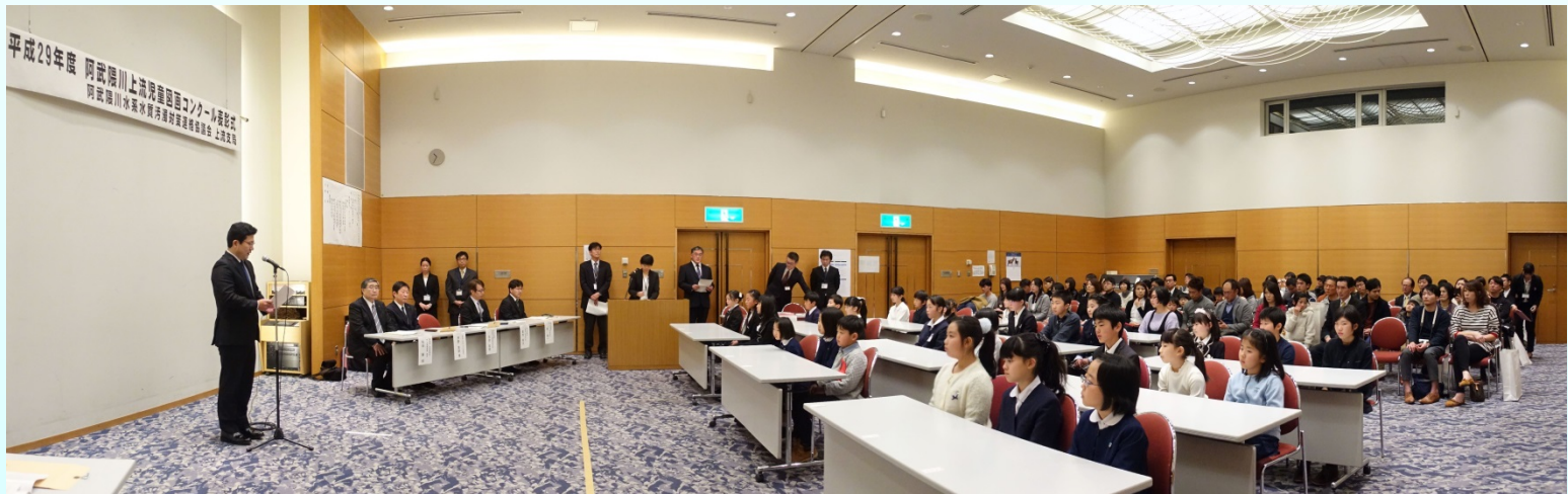
表彰式会場の様子