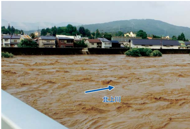
明治橋(盛岡市)H25.8洪水