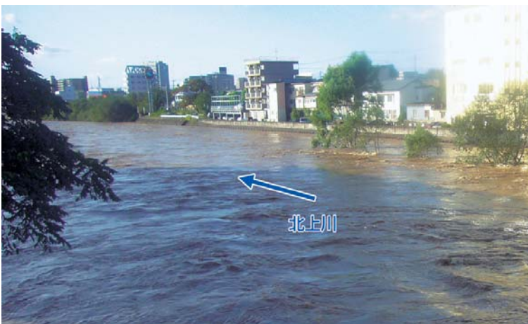
館坂橋下流(盛岡市)H25.9洪水