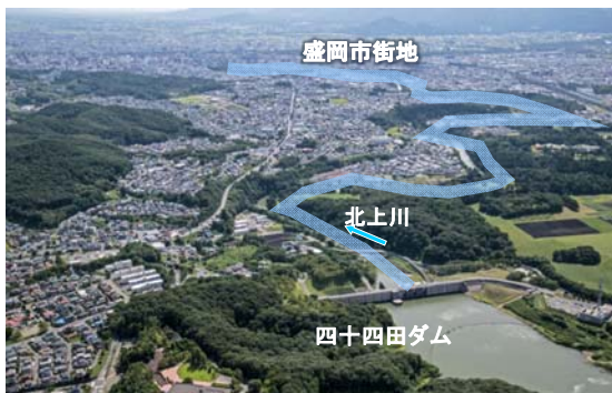
四十四田ダム下流に広がる盛岡市街地