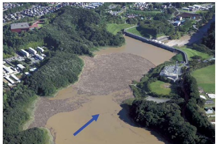
四十四田ダム洪水調節状況 H25.9洪水(流木の捕捉状況)