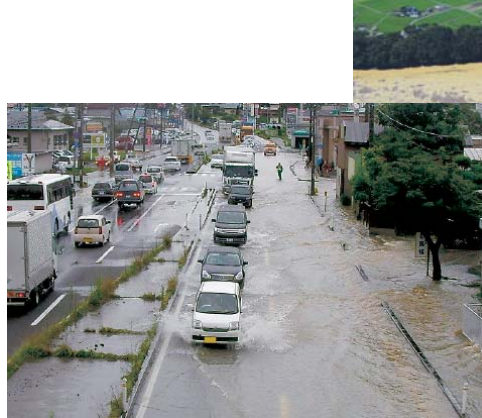
国道4号冠水状況(紫波町) H25.8洪水