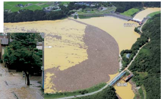
御所ダム洪水調節状況 H25.8洪水 (流木の捕捉状況)