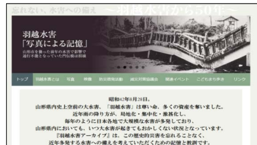
羽越水害記録写真の活用 羽越水害アーカイブ(山形河川国道事務所)