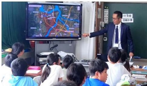
ハザードマップ【浸水想定区域】の活用イメージ (H29.10 大郷小学校出前講座)

過去の水害に関する記録写真・映像、地図情報や雨量レーダーなど行政機関が保有する資料を実際の教材として活用