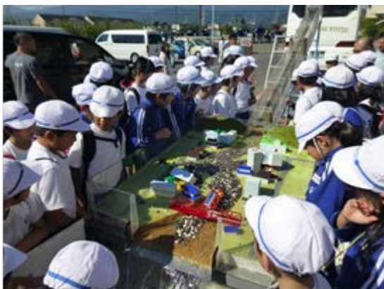
【土砂災害に関する出前講座】 福島市立庭坂小学校 (H27. 9. 28)