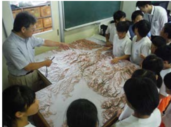
【火山災害に関する出前講座】 福島市立佐倉小学校 (H28. 9. 13)