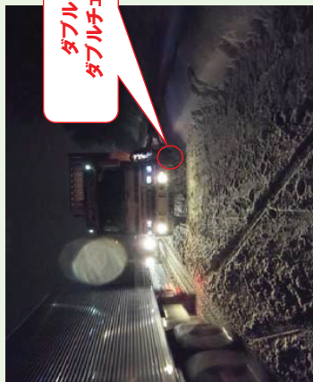
ダブルタイヤには ダブルチェーン装着を!!