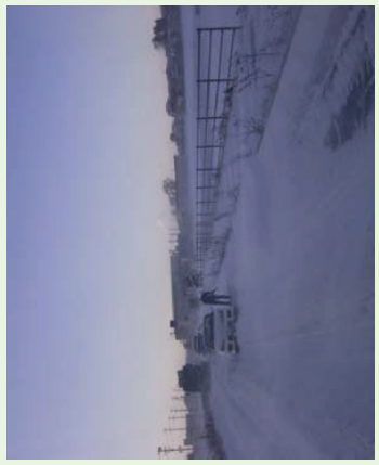
ダブルタイヤには ダブルチェーン装着を!!

冬タイヤは早めに装着しましょう! 雪道のノーマルタイヤ走行は違反です! 違反しての走行は罰則対象になります!