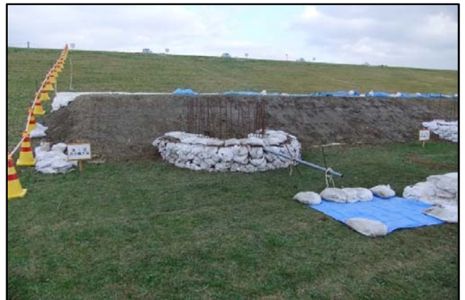
④「シート張り工」実施状況