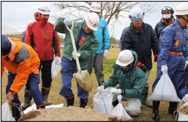
①「土のうの作り方」実施状況