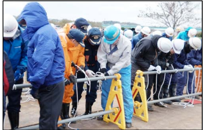
②ロープワーク（縄結び）実施状況