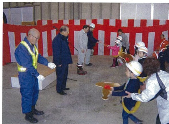
園児による鍵の引き渡し