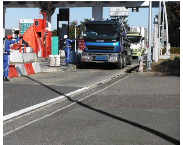
東北自動車道 白河ICにおける 取締状況