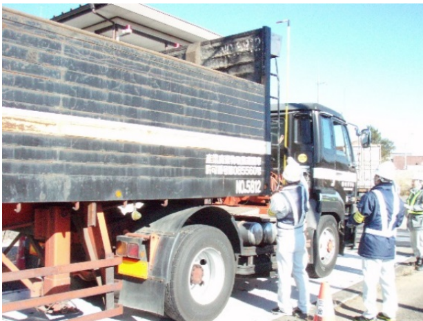
国道4号白河車両検測所における 取締状況