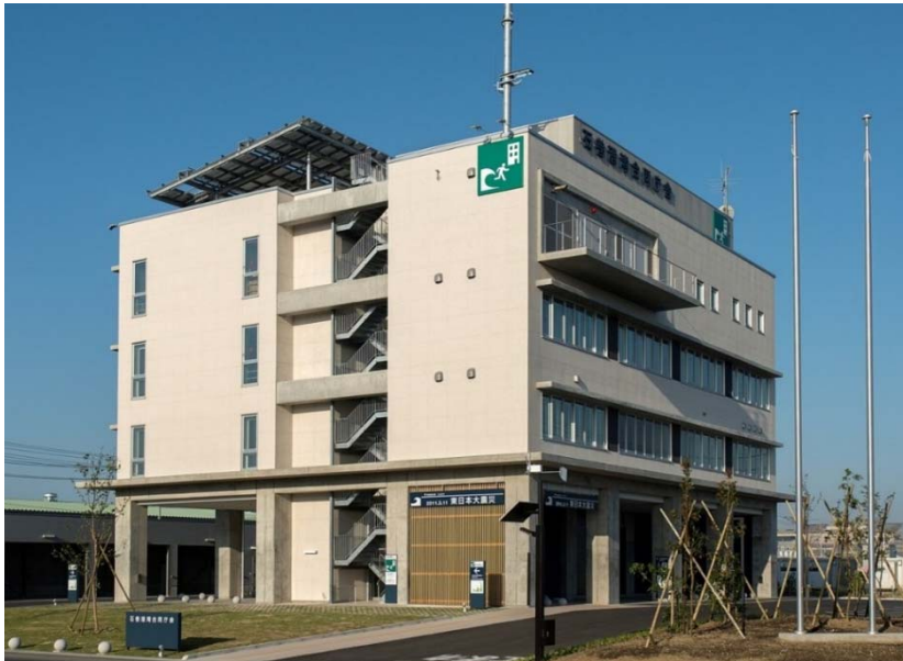
石巻港湾合同庁舎(国施設/平成26年5月完成)