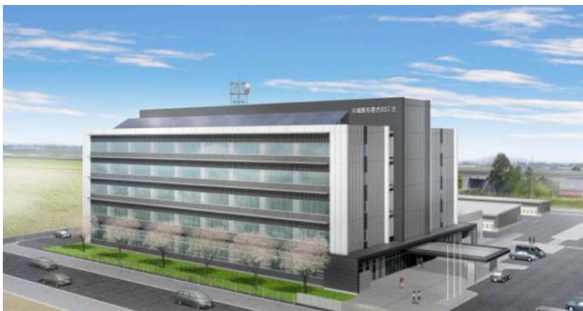
石巻合同庁舎(宮城県/平成30年1月完成予定<現在工事中>)