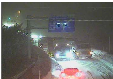
会津坂下町塔寺付近