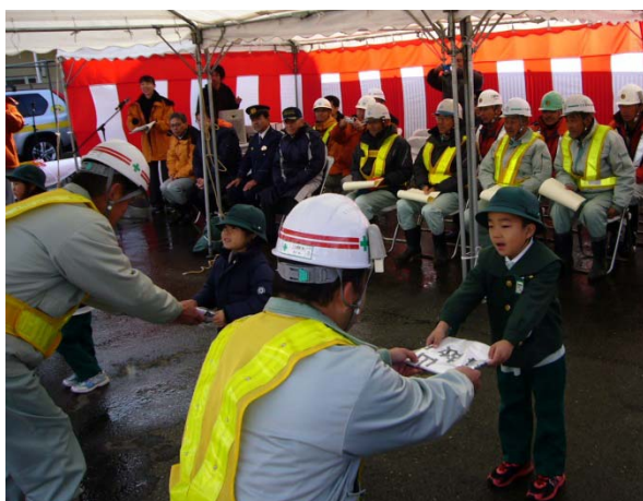
園児による安全旗の引き渡し