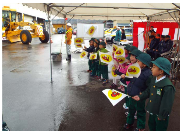
園児による除雪車始動命令