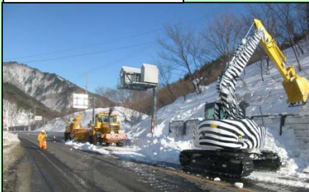
バックホウによる除去状況