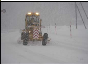
除雪グレーダによる作業状況