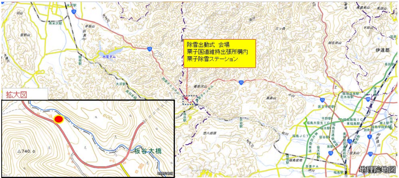
『この地図は、国土地理院長の承認を得て、同院発行の電子地形図（タイル）を複製したものである。（承認番号 平29東複、第33号）』