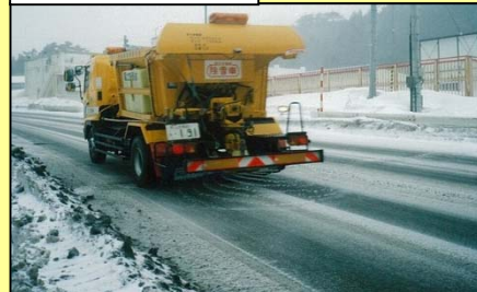
散布車による散布状況