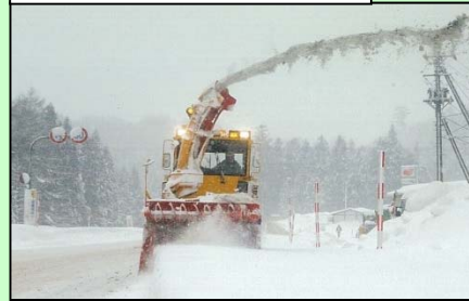
ロータリー除雪による作業状況