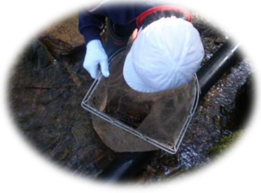
▲ハナカジカの捕獲