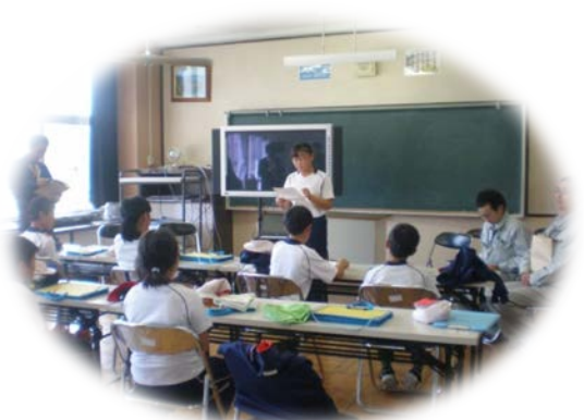
▲学習会の結果発表