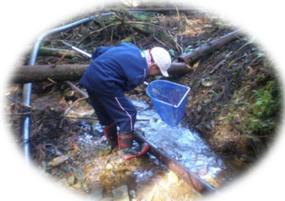
▲ハナカジカの捕獲