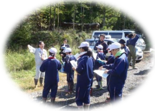
▲東北横断自動車道の説明