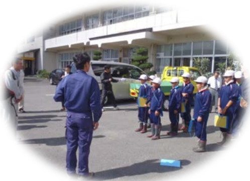
▲学習会の目的・概要説明