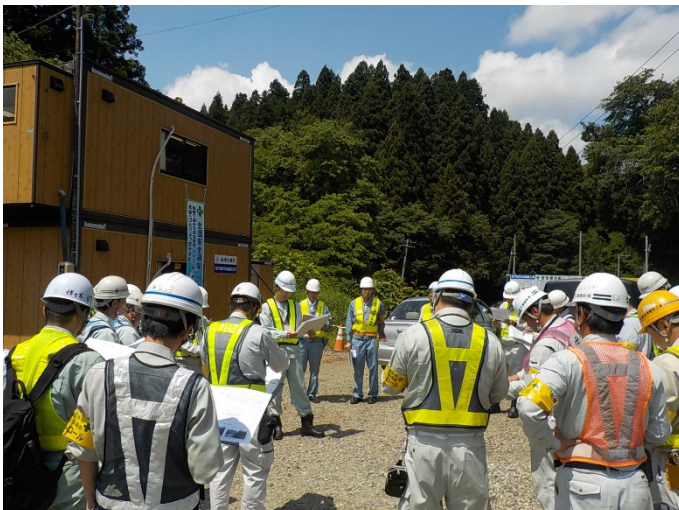
▼ 前回の労働災害防止検討会の様子 (H29.6.14 実施)