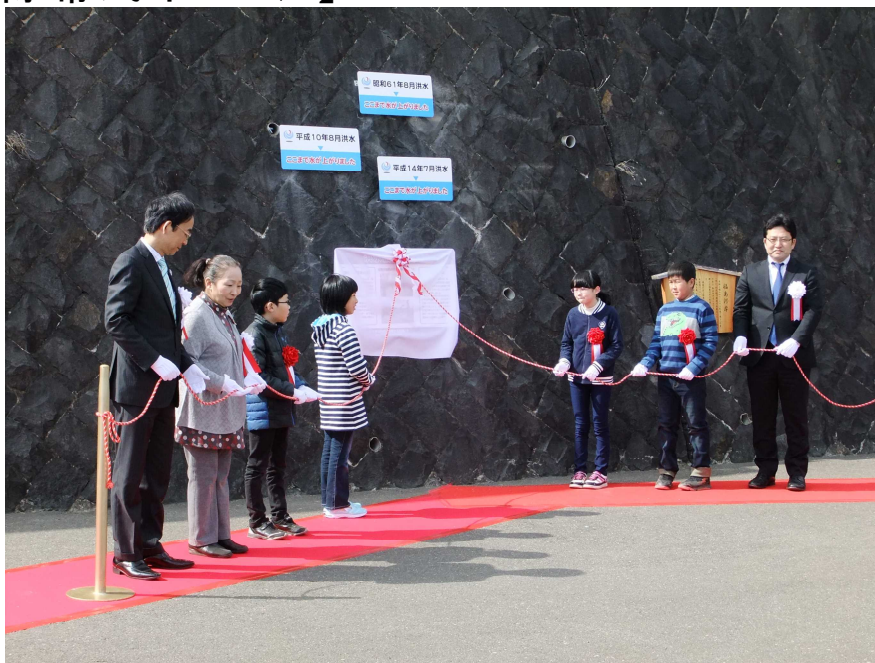
【隈畔リニューアル式での除幕式の様子(平成29年3月30日撮影)】