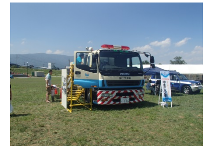
60m 3 /sの排水能力をもつ排水ポンプ車試乗