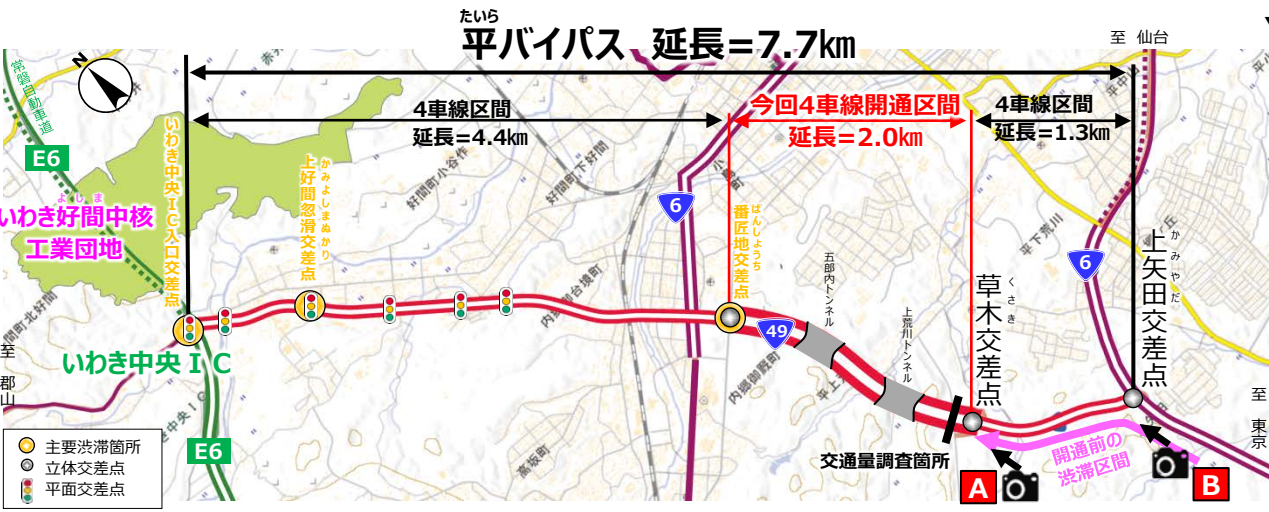
▼草木交差点の渋滞状況の変化▼ 上矢田交差点の渋滞状況の変化