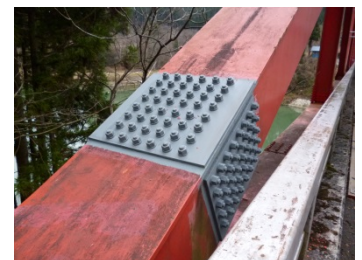
▲ボルト交換・下塗完了後