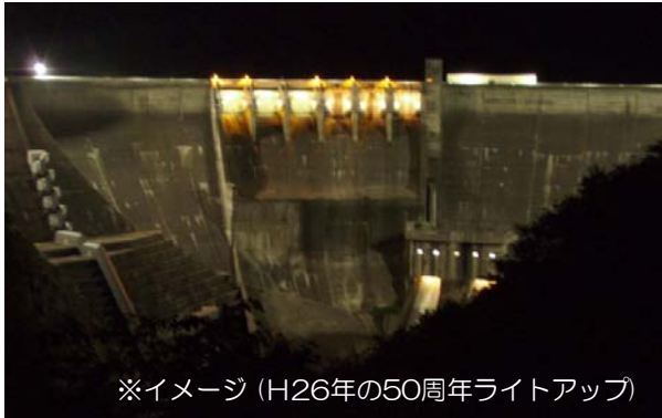
※イメージ（H26年の50周年ライトアップ）