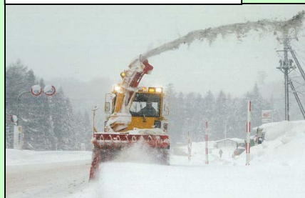
ロータリー除雪による作業状況