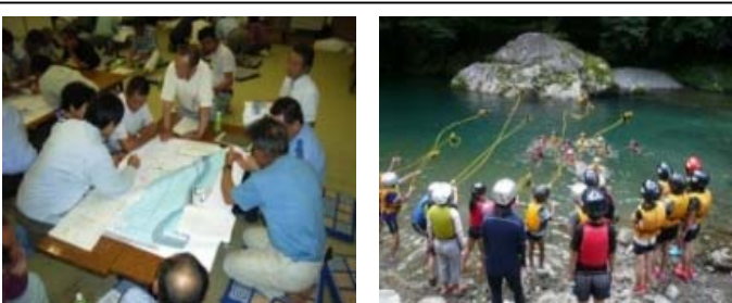
マイ防災マップづくり