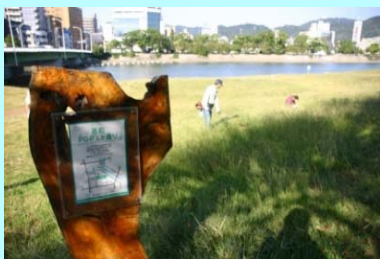
市民団体による看板設置事例（太田川）