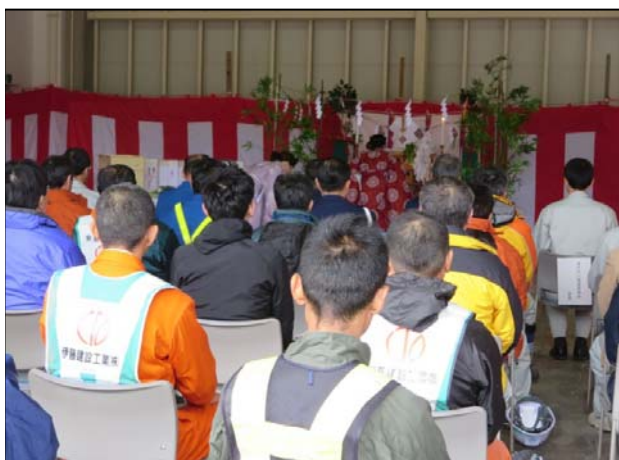
▲安全祈願式（請負業者主催）の様子