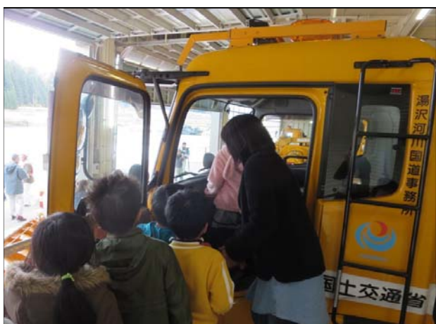
▲乗車体験会（事務所主催）の様子