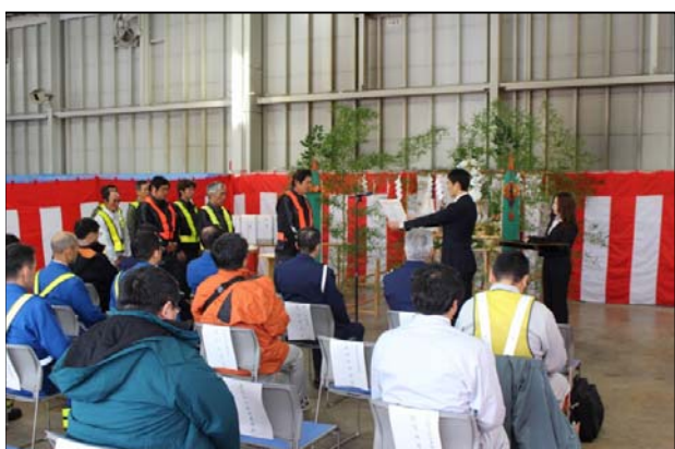
▲除雪機械出動式（事務所主催）の様子