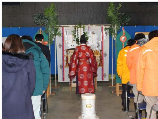
▲安全祈願式（請負業者主催）の様子