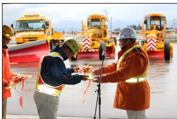
▲除雪機械出動式（事務所主催）の様子