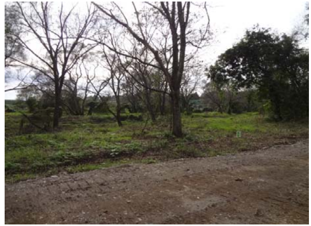
伐採前の写真(区画②)