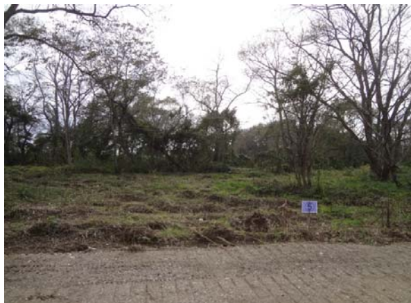
伐採前の写真(区画⑤)