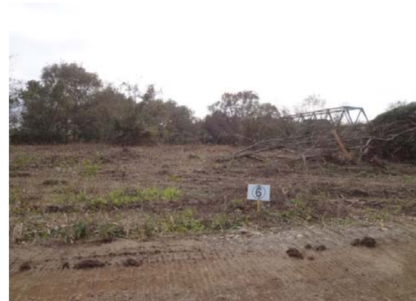
伐採前の写真(区画⑥)