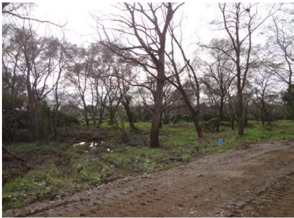
伐採前の写真(区画①)