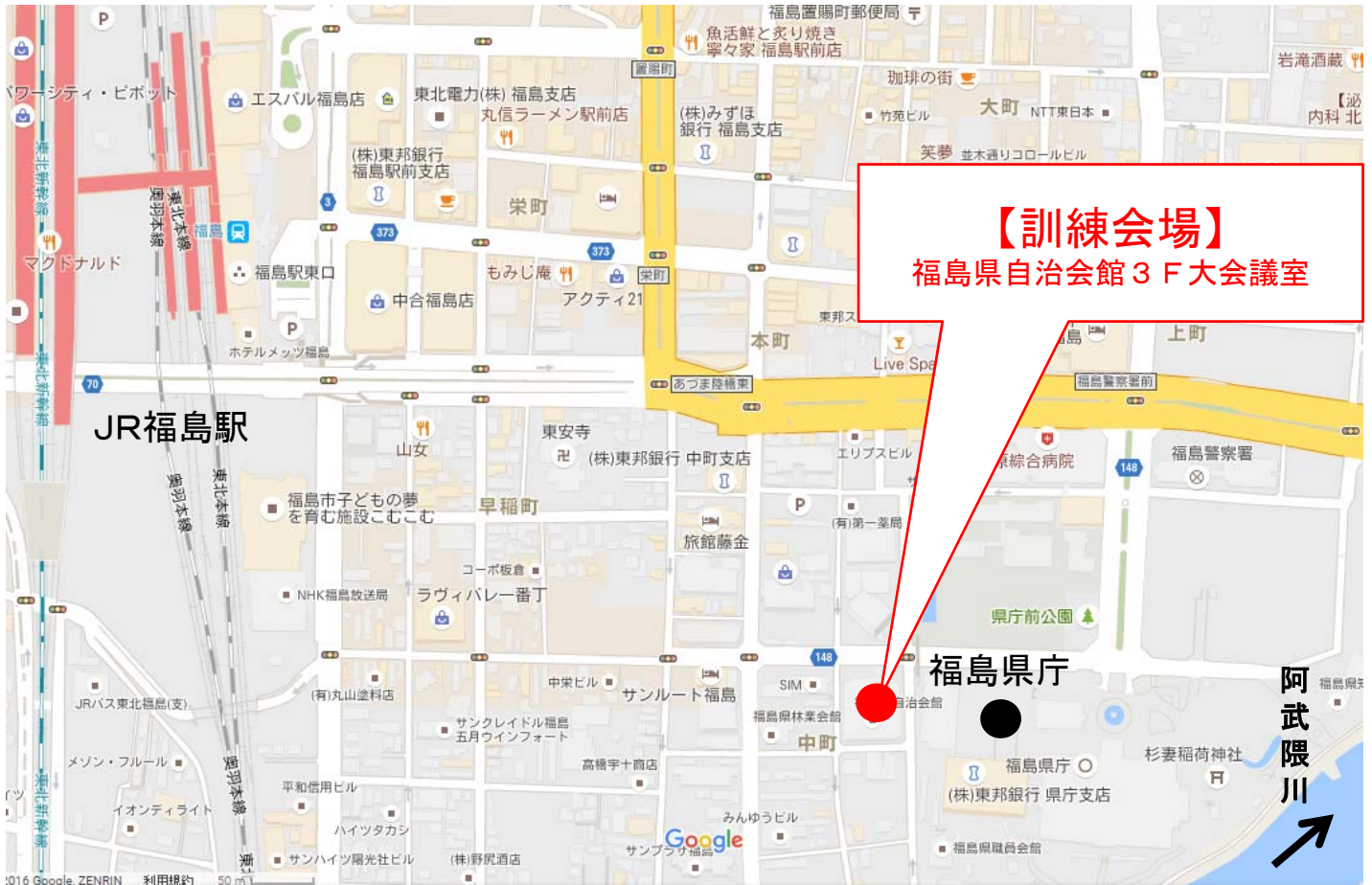
平成28年度 吾妻山火山防災訓練 会場位置図