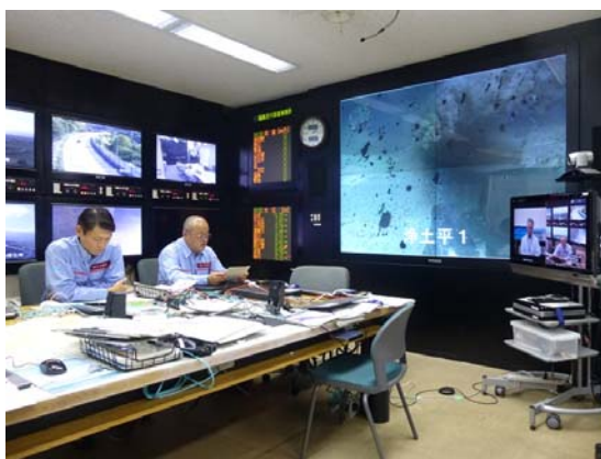
福島市とのテレビ会議訓練