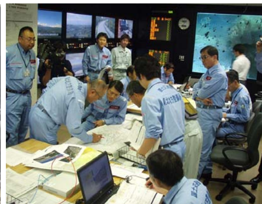
緊急対策の手順の確認