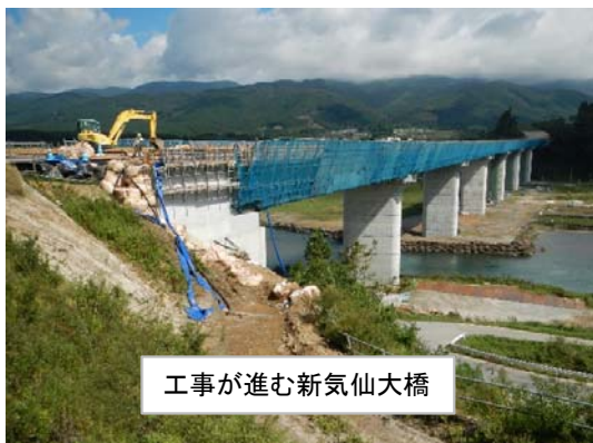
工事が進む新気仙大橋