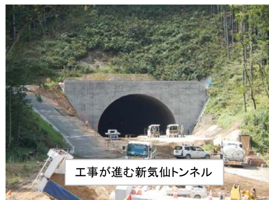
工事が進む新気仙トンネル