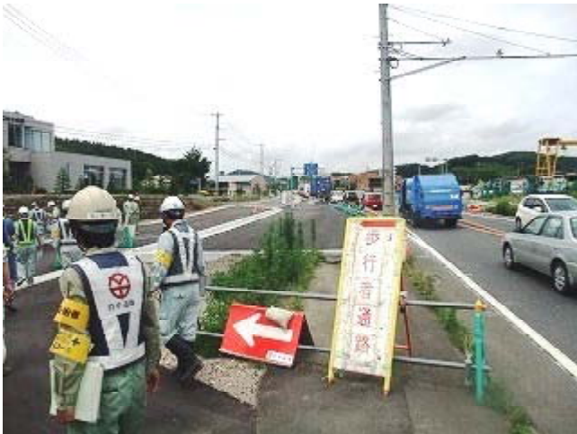
▲パトロールの様子