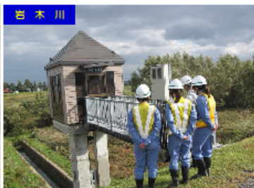
岩木川 河川パトロール実習の様子

参加された生徒の皆さんが今回のインターンシップを通して、実際に河川・道路・ダムの各現場を身近に体験することにより、国土交通行政への理解を更に深めていただければと思っております。