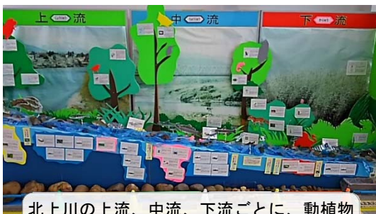
北上川の上流、中流、下流ごとに、動植物を個々に解説しています。

今回の巡回企画展「雨といきもの展」と併せて見学することで、いろいろな生き物について、より一層、知り、学ぶことができます。